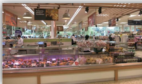
Tesco Extra Barhill

欧州小売は、売場・EC・物流を融合し、競争構造を変えています。 本視察では、Tescoの最先端に加え、欧州店舗の進化を横断的に学び、 自社に活かす視点を持ち帰ります。