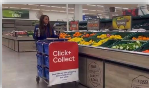
店舗内 マニュアルフルフィルメント