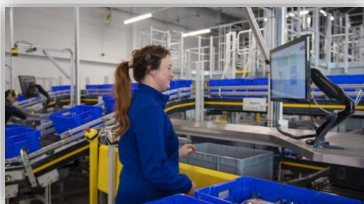
MFC フルフィルメント