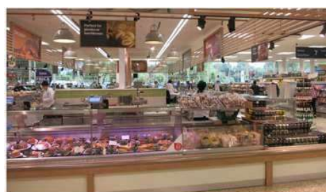
Tesco Extra Barhill

欧州小売は、売場・EC・物流を融合し、競争構造を変えています。 本視察では、Tescoの最先端に加え、欧州店舗の進化を横断的に学び、 自社に活かす視点を持ち帰ります。