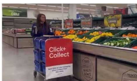
店舗内 マニュアルフルフィルメント