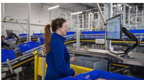
MFC フルフィルメント